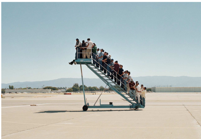
Adrian Paci, Centro di Permanenza temporanea , 2009

presso la Fondazione la Triennale di Milano | Salone d'Onore